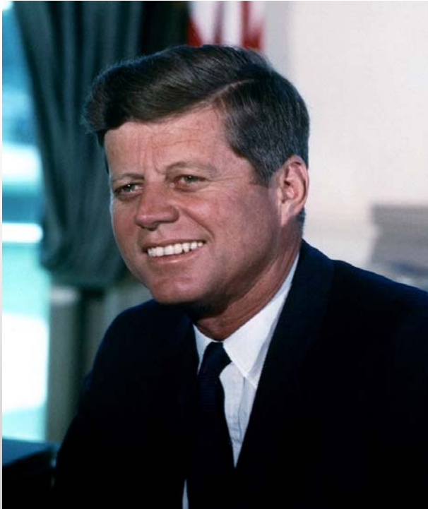
John Fitzgerald Kennedy Αμερικανός Πρόεδρος