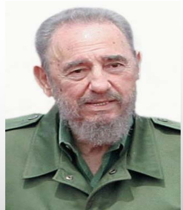
Fidel Castro Κουβανός επαναστάτης και πολιτικός Πρωθυπουργός της Κούβας