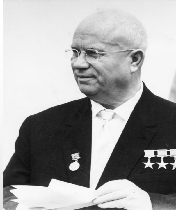
Nikita Khrushchev Ηγέτης της Σοβιετικής Ένωσης Γ.Γ. του Κομμουνιστικού Κόμματος